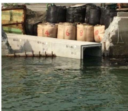
ボックスカルバート 山口県