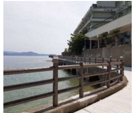
擬木フェンス 和歌山県