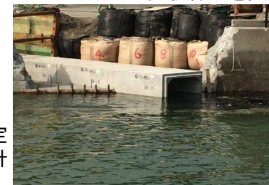
ボックスカルバート施工例

・クロロガードを使用したコンクリートの適用にあたっては、土木学会2017年制定コンクリート標準示方書などに則って設計する。